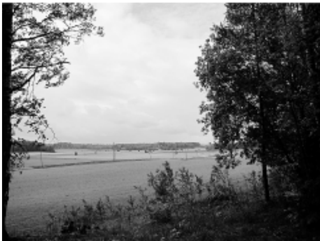
Espoossa voi vielä nähdä vielä maanviljelyskulttuurimaismaa

huomioitu riittävästi Korkeimman hallinto-oikeuden päätöstä, vaan Espoon kaupunki on jälleen havittelemassa rakentamista Näkinmetsän alueelle.