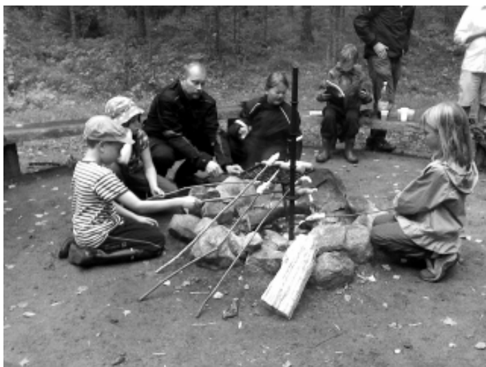
Tikkupullan paisto kruunasi retkipäivän.

Tikkupullanpaisto oli sekä lapsille että vanhemmille uusi kokemus. Pულlataikinan kääriminen tikun ympärille